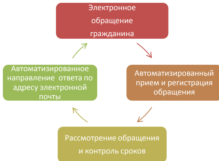
Рис. 2 Алгоритм оперативного рассмотрения электронных обращений граждан (диаграмма создана автором)

Для оптимизации работы с обращениями граждан необходимы следующие меры.